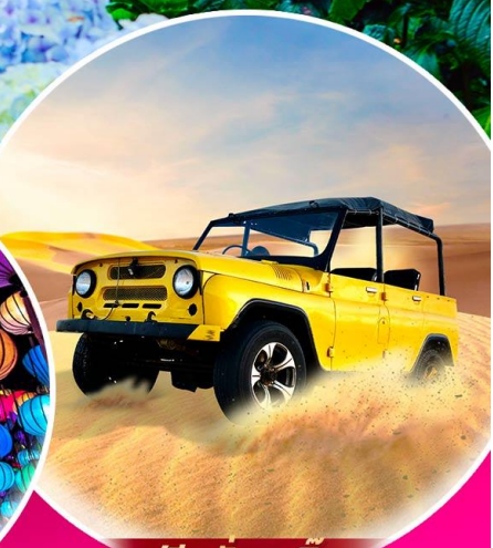
ฟรี! นั่งรถจี๊ป